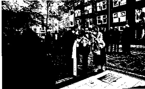
Dud en jong deden gisteren mee met de herdenking in de Gaaspstraat.