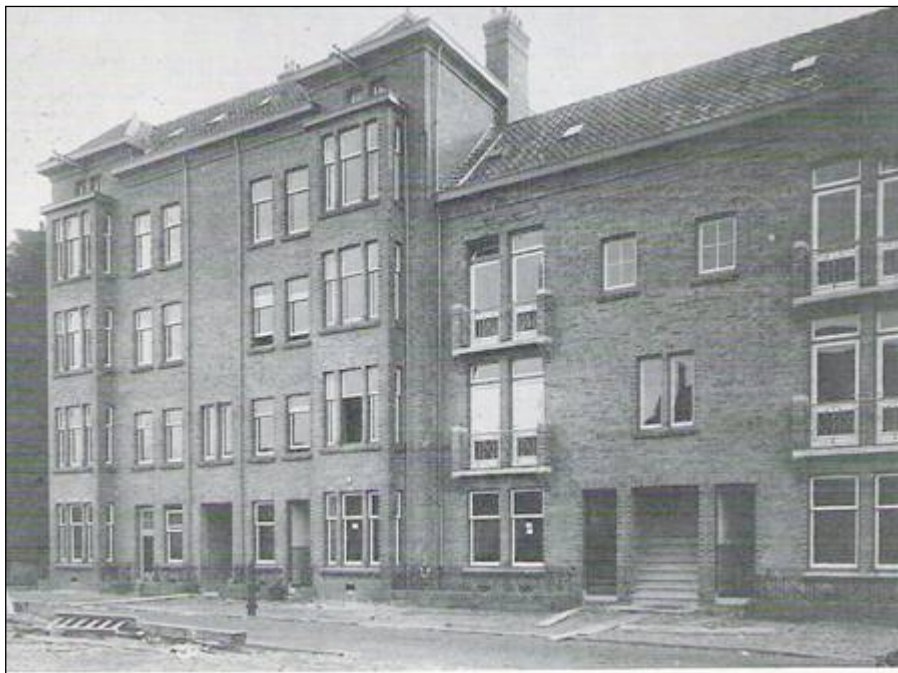
in mei 1915 betrokken de eerste bewoners de Trompenburgstraat